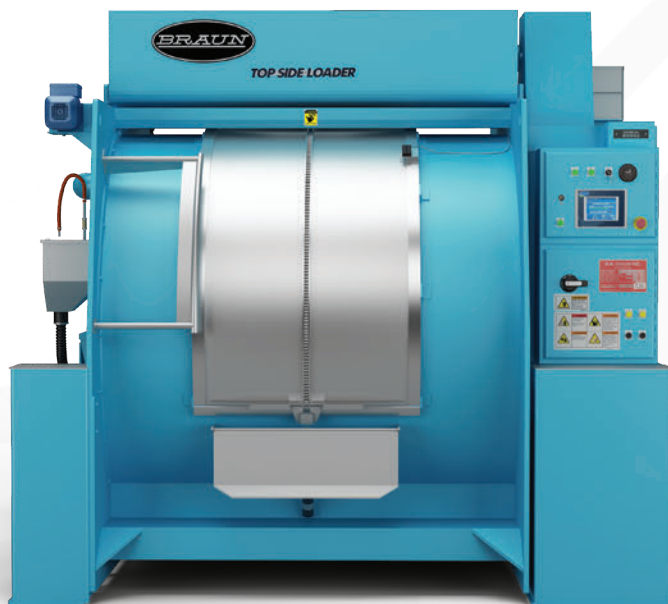
Lavadora/Extractor de Carga Superior Lateral