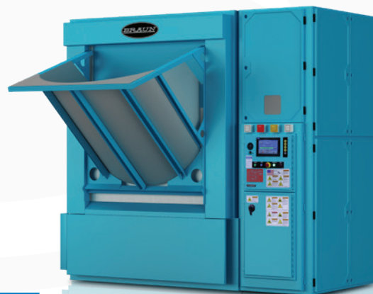
Secador con tolva de carga "pendiente de patente".

El sistema de carga con tolva de los secadores Braun esta pendiente de patente. En este sistema las bolsas se posicionan y descargan en el secador para ser procesadas. Proveyendo así cargas más rápidas e incrementando la eficiencia. Este secador tiene gran flexibilidad en relación a la configuración del área de lavado. No existe límite con relación a los tipos de prendas que pueden ser procesados.