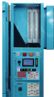
Secador PT Bobinas de Vapor